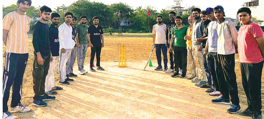
हरिभूमि न्यूज | गंजबासोदा

अखिल भारतीय विद्यार्थी परिषद इकाई गंज बासोदा द्वारा "Screen Time to Activity Time" अभियान के अंतर्गत प्रोफेसर एवं अभावपि कार्यकर्ताओं के बीच सद्भावना क्रिकेट मैच का आयोजन किया गया। इस रोमांचक मुकाबले में टीएस अभावपि 11 ने जीतकर पहले बल्लेबाजी करने का निर्णय लिया। निर्धारित 8 ओवर में ABVP 11 की टीम ने प्रोफेसर 11 के सामने 85 रन का लक्ष्य रखा। जवाब में लक्ष्य का पीछा करने उतरी