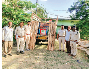
काष्ठ चिरान अधिनियम 1984 एवं व्यापार अधिनियम 1969 के तहत वन अपराध दर्ज कर कार्रवाई जारी है।